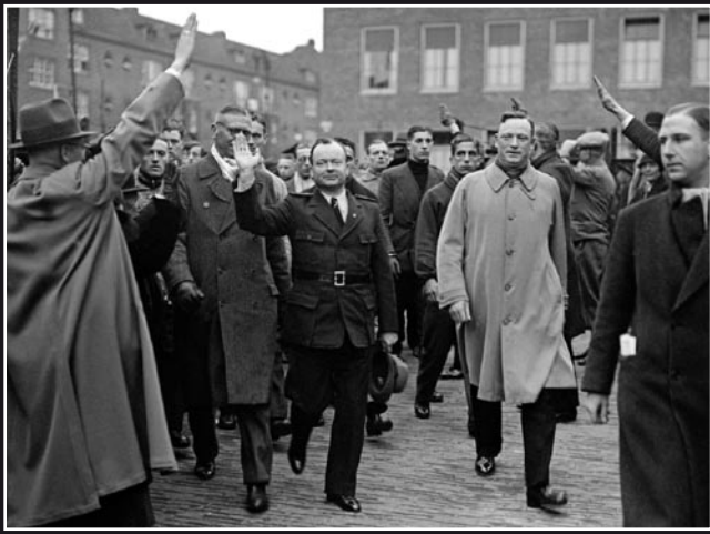
Met Anton Mussert voorop gaan deelnemers van een NSB-landdag op weg naar de RAI, 30 maart 1935

Verder zijn er in Duitsland verschillende instanties die zich bezighouden met of kennis hebben van het zoeken naar Duitse militairen. Zo kan het de moeite waard zijn om contact op te nemen met de Arbeitsgemeinschaft für Kameraden-werke und Traditionsverbände in Stuttgart. Dit is een overkoepelende organisatie van veteranenverenigingen in Duitsland. De Kirchlicher Suchdienste HOK (Heimatortskarteien) beheren overgebleven officiële papieren uit de voormalige Ostgebiete . Deze kerkelijke zoekdiensten houden zich voornamelijk bezig met de zoektocht naar Vertriebenen . Zij hebben vestigingen in München, Stuttgart en Passau. Ook het Deutsches Rotes Kreuz (website: www.drk.de ) heeft een zoekdienst die bemiddelt bij zoektochten naar vermiste personen. Tot slot kan in Nederland de Stichting Ambulante Fiom hulp bieden tijdens een (inter)nationale zoektocht naar familieleden.